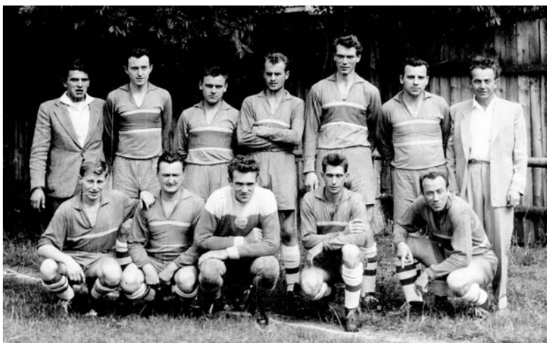
Před zápasem ve Vrahovicích, rok 1961