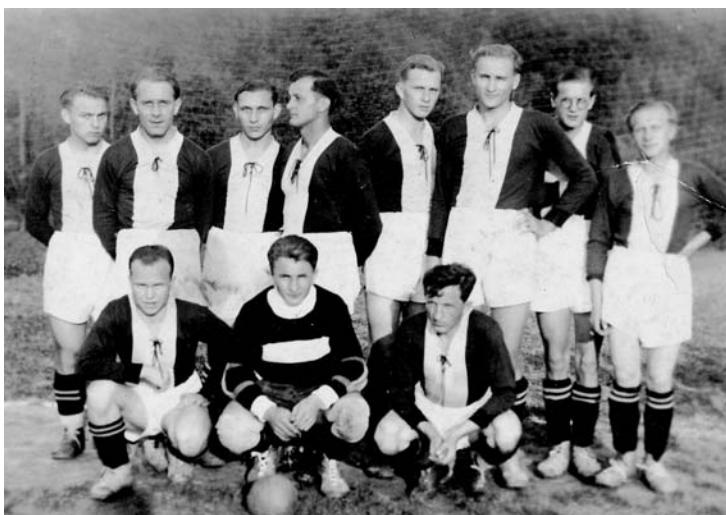
Jesenec, hřiště v Konici pod Bídovem, polovina 30. let