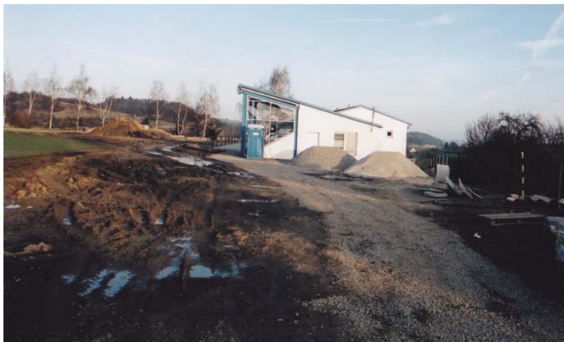
V průběhu rekonstrukce, rok 2007