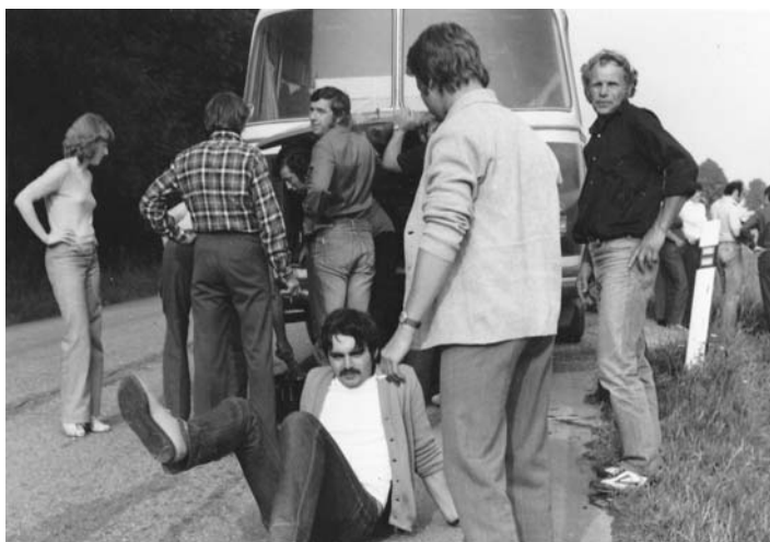
Cesta do Českých Budějovic