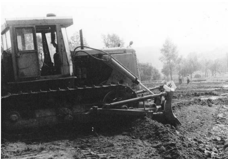
Budování dolního hřiště, rok 1987