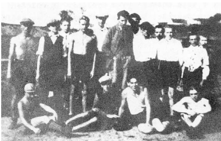
Jesenec – Konice, nejstarší dochovaná fotografie, rok 1932

V té době se hrávalo na posečené louce U Chmelníka, za Horkou i jinde. Z těchto let pochází také dochovaná fotografie mužstev Jesence a Konice, která se utkala na louce U Chmelníka.