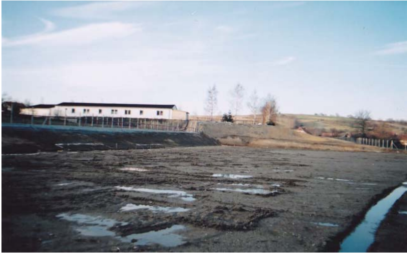
Před vybudováním hrací plochy, rok 2007