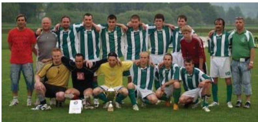
„A“ mužstvo, vítěz krajského poháru ČMFS, jaro 2008

V ročníku 2007/2008 si výborně vedl i rezervní celek, který ve IV. třídě z osmnácti zápasů vyhrál dvanáctkrát, dvakrát remizoval a čtyřikrát odešel poražen. Tyto výsledky jej vynesly na první místo a béčko se tak po třech letech vrátilo do III. třídy. Nezapomenutelným se stal předposlední zápas doma s Horním Štěpánovem, který byl na druhém místě a také chtěl postoupit. Velmi tvrdé utkání vyhráli domácí 4:3.