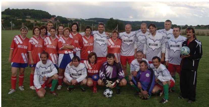
Pouťové utkání „Ženy“ – „Staří páni“, rok 2009